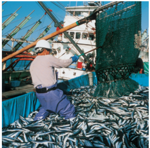
サンマの水揚げ（いわき市）