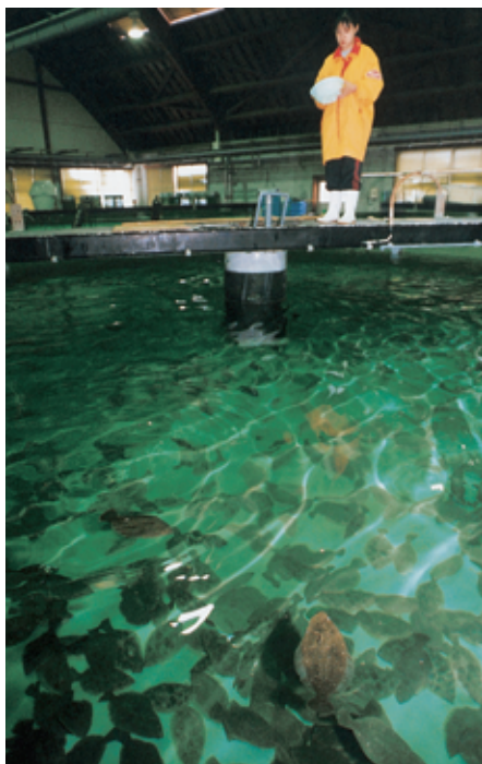
ヒラメ栽培漁業振興施設（大熊町）

ヒラメなど昔と比べて少なくなってきた魚は、人工的に卵から育てて海に放して魚の数を増やすなどの「つくり育てる漁業」や小さい魚はとらないなどの「資源管理 しげんかんり 」が行われています。また、相馬市の松川浦では、アオノリやアサリなどの養殖がさかんに行われています。