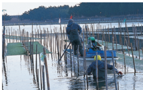
アオノリの養殖（相馬市）

ヒラメなど昔と比べて少なくなってきた魚は、人工的に卵から育てて海に放して魚の数を増やすなどの「つくり育てる漁業」や小さい魚はとらないなどの「資源管理 しげんかんり 」が行われています。また、相馬市の松川浦では、アオノリやアサリなどの養殖がさかんに行われています。