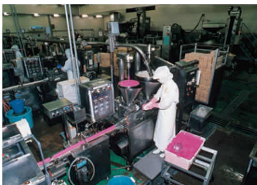
かまぼこ工場（いわき市）

中通りのため池などではコイが、会津の山間部や阿武隈高地ではイワナやニジマスなどが養殖されていて、とくにコイの養殖生産量は全国第1位(平成16年)