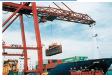
小名浜港(いわき市)でのコンテナ積みこみ