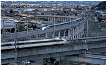
東北・山形新幹線（福島市）