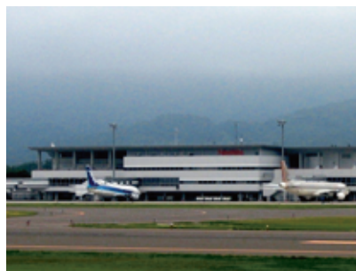
福島空港（須賀川市、玉川村）

小名浜港や相馬港からは、工場で使 う原料や作った製品などが世界の多く の国々と行き来しています。