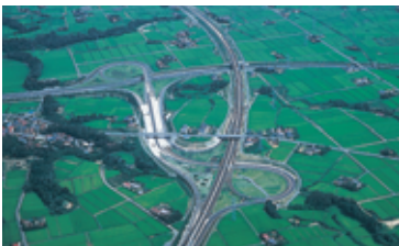
東北自動車道郡山ジャンクション（郡山市）