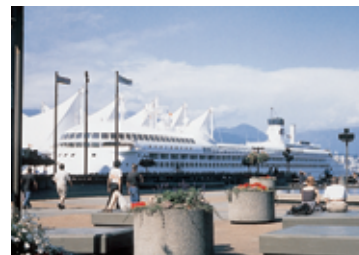
バンクーバーの港 (カナダ・ブリティッシュコロンビア州)