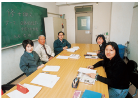
福島大学で学ぶ留学生（福島市）