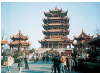
武漢にある黄鶴楼 (中国・湖北省)