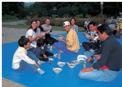
外国人との交流（磐梯町）

毎年、二本松市にある二本松青年海外協力隊訓練所で学んだ隊員たちが、アジア、アフリカなどの国に行き、現地の人々と共にその国のためのボランティア活動をしています。