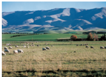
草原での羊の放牧 (ニュージーランド)