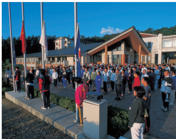
二本松青年海外協力隊訓練所（二本松市）

毎年、二本松市にある二本松青年海外協力隊訓練所で学んだ隊員たちが、アジア、アフリカなどの国に行き、現地の人々と共にその国のためのボランティア活動をしています。