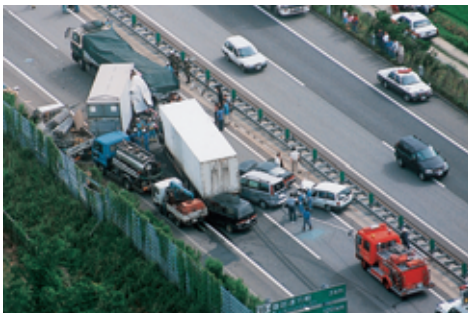
高速道路での追突事故

交通事故は、交差点やその付近でよく起こっています。また、交通事故の多くは、わき見をしながらの運転やスピードの出しすぎのために起こっています。