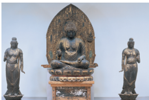
国宝 しょうじょうじもくそうやくしにょらいおびりようきようじろう 勝常寺木造薬師如来及両脇侍像（湯川村）