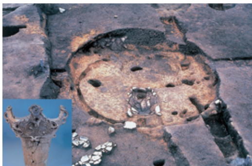
ほうじょうじり 法正尻遺跡（磐梯町）