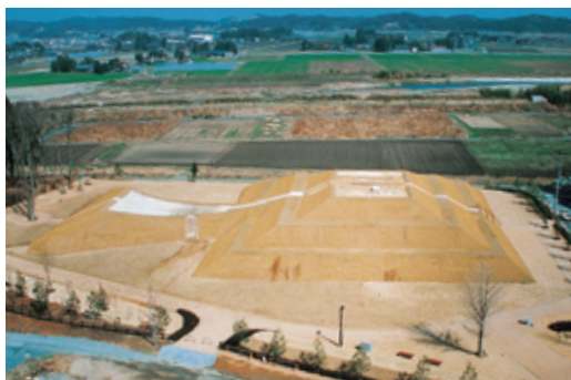
史跡 桜井古墳（南相馬市）

県内には、国宝や国の重要文化財など昔の人々によって生み出された文化的な遺産があちこちにあります。