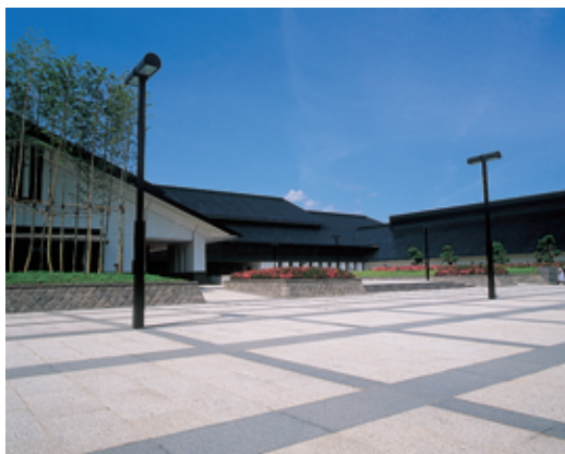
県立博物館（会津若松市）

会津若松市にある県立博物館と白河市にある県文化財センター白河館（まほろん）には、昔使われていた道具などがたくさん展示されていて、原始時代から現代までの福島県の歴史を楽しく学ぶことができます。