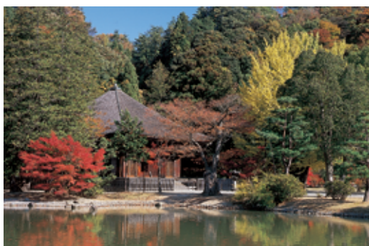
国宝 しらみずあみだどう 白水阿弥陀堂（いわき市）

県内には、国宝や国の重要文化財など昔の人々によって生み出された文化的な遺産があちこちにあります。