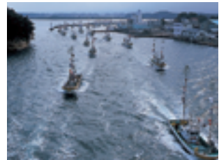
松川浦漁港の漁船回