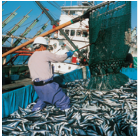
サンマの水揚げ（いわき市）