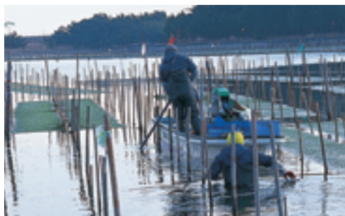
アオノリの養殖（相馬市）

ヒラメなど昔と比べて少なくなっている魚は、人工的に卵から育てて海に放して魚の数を増やすなどの「つくり育てる漁業」や小さい魚はとらないなどの「資源管理 しげんかんり 」が行われています。また、相馬市の松川浦では、アオノリやアサリなどの養殖がさかんに行われています。