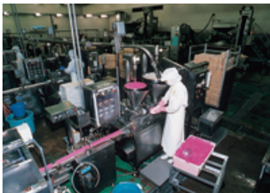
かまぼこ工場（いわき市）

中通りのため池などではコイが、会津の山間部や阿武隈高地ではイワナやニジマスなどが養殖されていて、とくにコイの養殖生産量は全国第1位(平成17年)