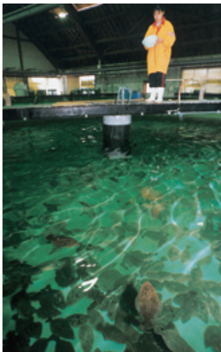
ヒラメ栽培漁業振興施設（大熊町）

ヒラメなど昔と比べて少なくなっている魚は、人工的に卵から育てて海に放して魚の数を増やすなどの「つくり育てる漁業」や小さい魚はとらないなどの「資源管理 しげんかんり 」が行われています。また、相馬市の松川浦では、アオノリやアサリなどの養殖がさかんに行われています。