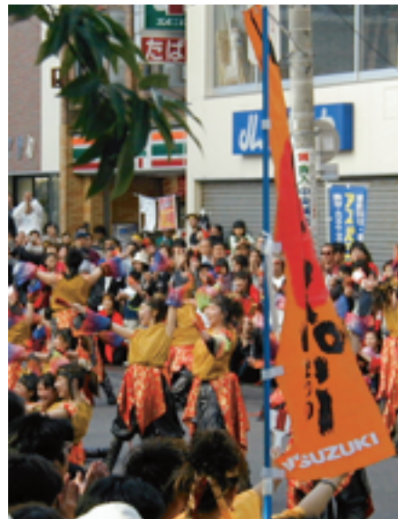
郡山市中央商店街