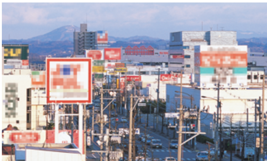
道路沿いには大型小売店が並んでいる（郡山市）

商店の中で最近増えているのが、大型小売店と呼ばれるスーパーマーケットやホームセンター、大型専門店などの大きな店です。これらの店の多くは街の中心部からはなれた大きな道路沿い そ にあり、何千台もの車がとめられる広い駐車場がある店もあります。