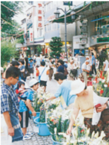
福島市 パセオ通り