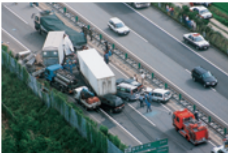
ついでつ 高速道路での追突事故

交通事故は、交差点やその付近でよく起こっています。また、交通事故の多くは、わき見をしながらの運転やスピードの出しすぎのために起こっています。