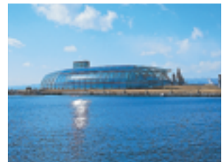
アクアマリンふくしま (ふくしま海洋科学館)