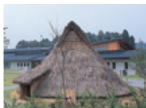
まほろん(県文化財センター白河館)

あぶくま 阿武隈川の源流がある県南地域は、東北の玄関口として古くから栄え、たくさんの文化財があります。また、工場の進出もさかんです。