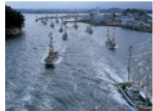
松川浦漁港の漁船回