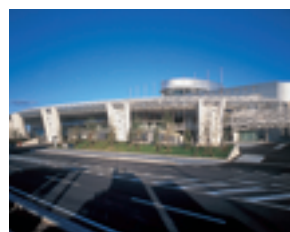
ビッグパレットふくしま