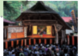
⑩檜枝岐歌舞伎 (檜枝岐村)