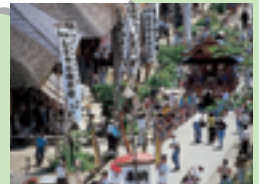
⑩大内宿半夏まつり(下郷町)