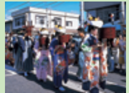
⑬田島祇園祭 (南会津町)