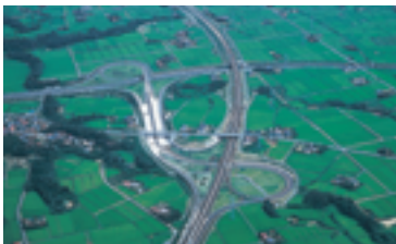
東北自動車道郡山ジャンクション（郡山市）