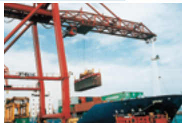
小名浜港（いわき市）でのコンテナ積みこみ