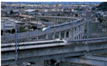
東北・山形新幹線（福島市）