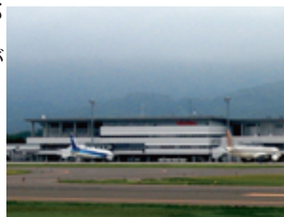
福島空港（須賀川市、玉川村）

小名浜港や相馬港からは、工場で使う原料や作った品物などが世界の多くの国々と行き来しています。