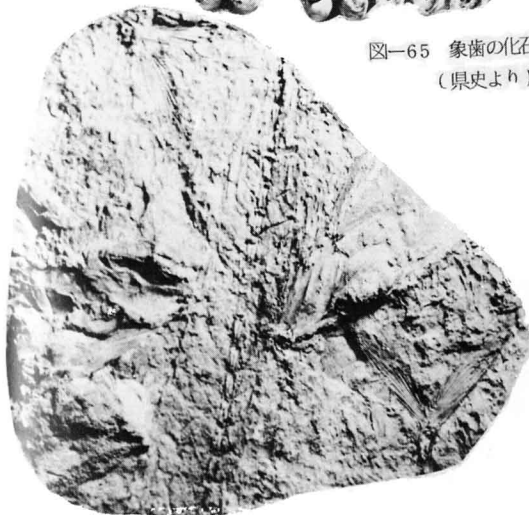
図-66 魚の化石・福島信夫山（県史より）