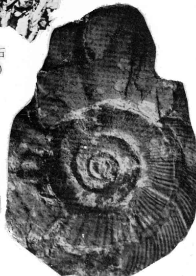
図-67 大型アンモナイト （いわき市・根本守原図より）