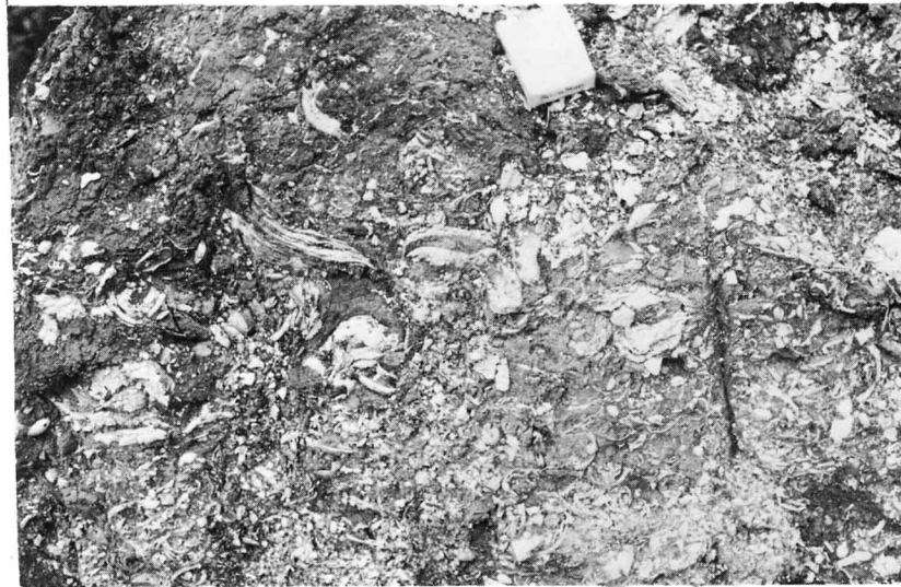
図-64 化石（二枚貝, 巻貝）が密集する地層（東白川郡埴町）