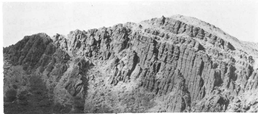
図-83 流れた溶岩(吾妻山)