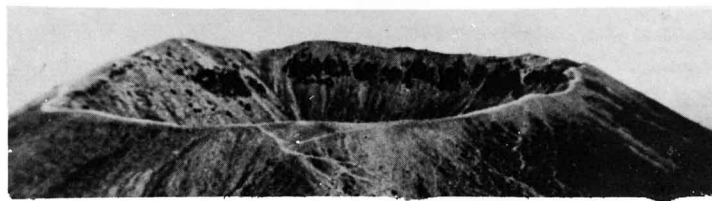
図-97 水のたまっていない火口(吾妻小富士)