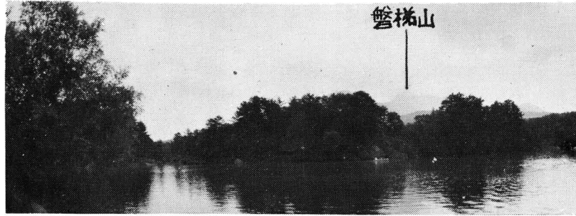
図-101 五色沼の中の毘沙門沼