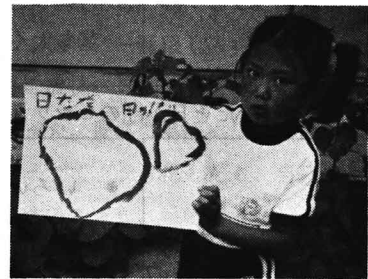
写真4 日なたと日かげの葉はこんなに違うよ。