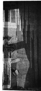
写真6 日かげのヒマワリ