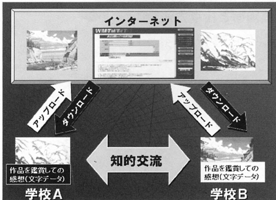
【インターネットで使った場合の構想】（図4）

（図4）はインターネットを利用し、学校A、Bで作品をアップロード(発信)し、お互いの作品のダウンロード(鑑賞)、感想のアップロード(返信)を図式化したものです。学校や地域といった空間を越えた鑑賞学習の中で作品を通じた知的交流が行われ、学習意欲の向上とともに、互いの表現のよさや個性・地域性などを認め合い尊重し合う共感的な態度の育成をねらいとしています。