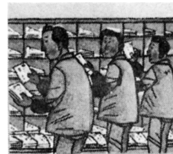
いきさきごとに わける