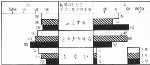
表12: 食事のしたく、片づけなどの仕事を する・しないの程度

食事のしたく、片づけなどの食生活に関する仕事を「よくする」は6年生の女子に多く62%を占めている。