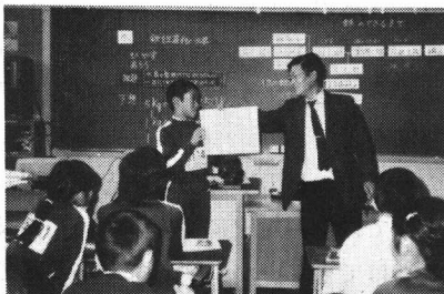
「検証授業Ⅲ」「わあー大きいプールだぞ」