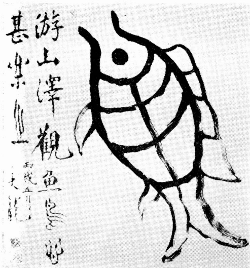
昭和21年の色紙 象形文字魚を大書し讀を入れたもの