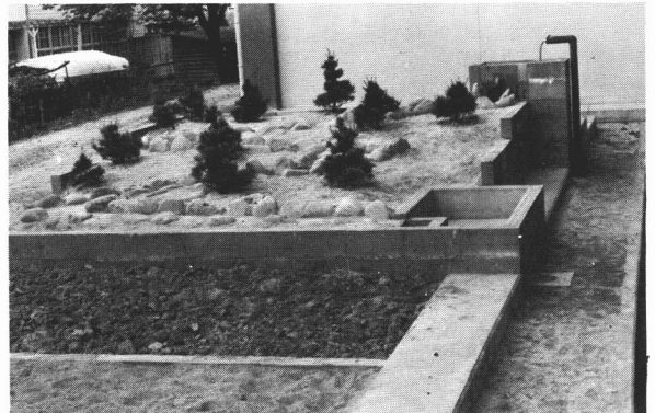
側面から見た理科学習園

川の曲り方, 傾斜角川幅について予備実験で確かめてから工事に入ることが大切である。