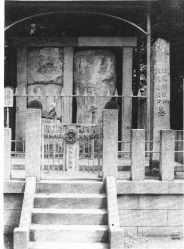
(佐藤嗣信・忠信の墓)