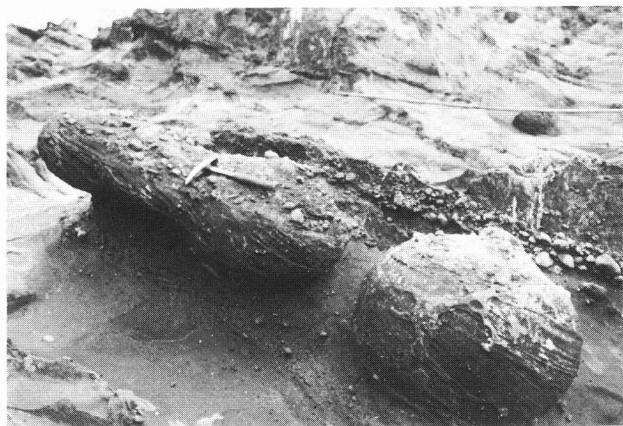
波立薬師に見られるボール岩

固結度の大きい部分が、海食作用にうちかかって残り、長い年月で、表面がけずられボール状になった。