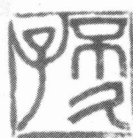
不 久 子