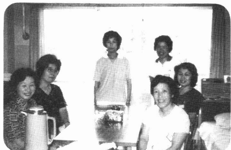
みんなとお友達になれてよかったわ! 〈宿舍でのくつろぎ〉