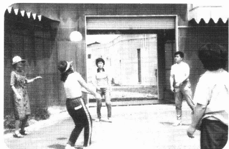
まもなく体育館が出来るんだって。 〈昼食後のひと時〉