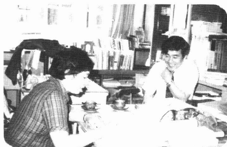
それはよいアイデアですね。 〈教育研究法講座 所員との相談〉