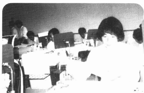
あれ! どうなっちゃってんのかな? 〈高校生のプログラミング実習〉