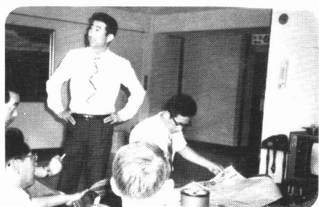
久しぶりにお昼のテレビを見たね。 〈昼食後のひと時 宿舍ロビー〉