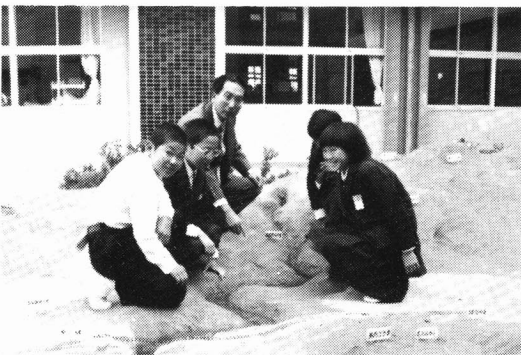
流水のはたらきの実験ができる