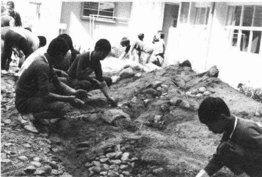
岩石園作りのようす