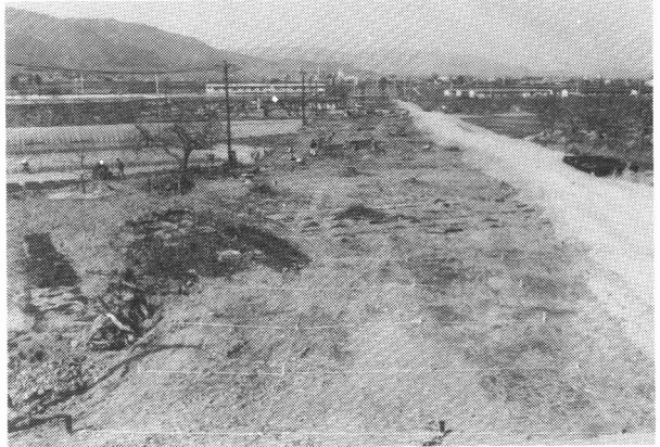
孫六橋遺跡（弥生時代・紀元0年頃）の近景