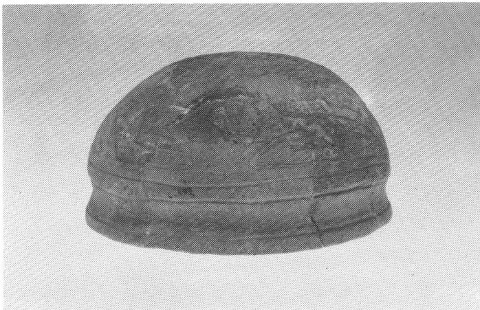
上：孫六橋遺跡出土の弥生式土器（蓋）・高さ10cm