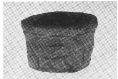
右：孫六橋遺跡出土の弥生式土器（小形土器）・高さ3.6cm