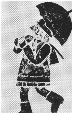
粘土に型おしをし、その上に石こうを流してつくった作品