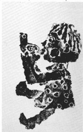
板紙凸版と、きりとり紙版による作品