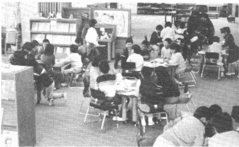
←＜ オープン・スペースを活用した学習 ＞

教室に接続した広いオープン・スペースを活用し、伸び伸びと社会科の学習をしている子どもたち。カーペットを張った床・キャスターのついた種類の多い机や戸棚、快適な暖房や自然光の取り入れなどに工夫が見られる。