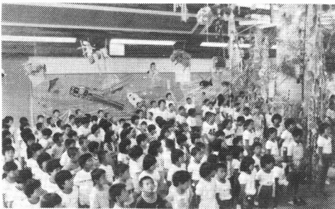
←＜ 多目的ホールを活用したたなばたまつり ＞

校舎の中央に、中庭と接して設けられた多目的ホール。この広い空間を利用して教科の学習はもちろん、学校の創意工夫が生かされ、学校行事や集会などが行われる。天井板には古い校舎の床板を利用している。新しい息吹きの中に古い伝統を残そうとしている。