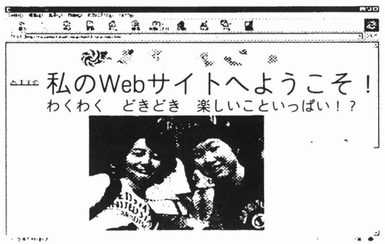
ホームページ作成例 (FrontPage98)

いろいろなアプリケーションソフトを体験し、短期間にパソコンをマスターすることができます。あなただけのオリジナルインターネットホームページ/研究授業や資料作成に役立つプレゼンテーション/イラストを作ったり写真画像を加工編集するマルチメディア/住宅のデザインや家庭科の被服、そして数学の図形作成に役立つCAD（正確な図面を作成するソフト）等、パソコンを幅広く活用する講座です。