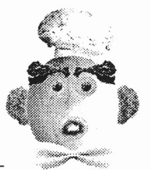
野菜で作る顔の例 (PhotoShop使用)