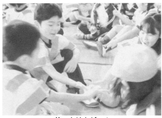
じゃんけんゲーム

錦星幼稚園の園児を迎え、前もって招待状 を手渡したお相手さんの園児を捜して、「や きいもグーチーパー」に合わせてじゃんけん ゲームをした。1回目の交流会以来であつた が、すぐに打ち解けて笑顔でじゃんけんやお みこし担ぎをしていた。