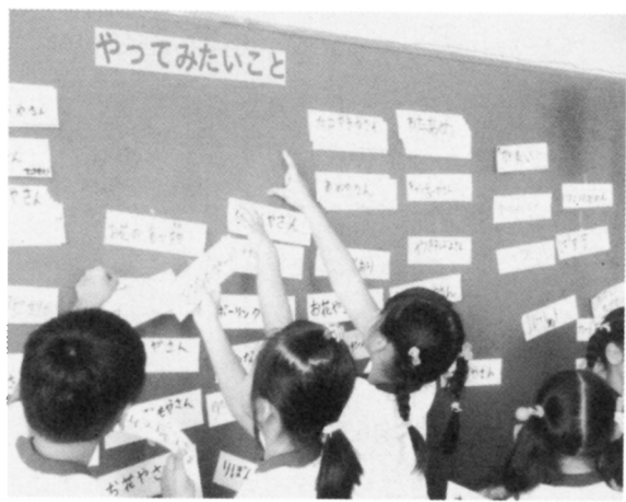
KJ法のカードを貼る児童

その後、自分がやってみたいことや、一緒 に活動したい友達などによりグループを編成 し、おおまかな話し合いをさせた。